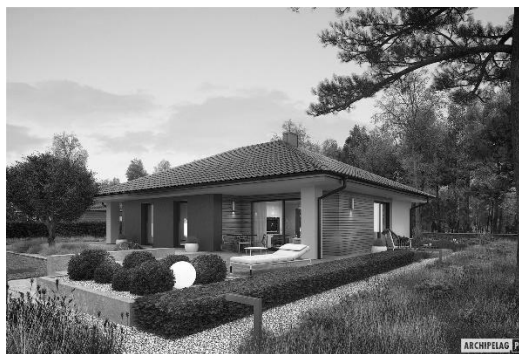
Ryc. 2. Mini 4, projekt domu, Archipelag

Źródło: Architektura małych domów , pod red. J. Nowaka, Arkady, Wrocław 2007, s. 135.